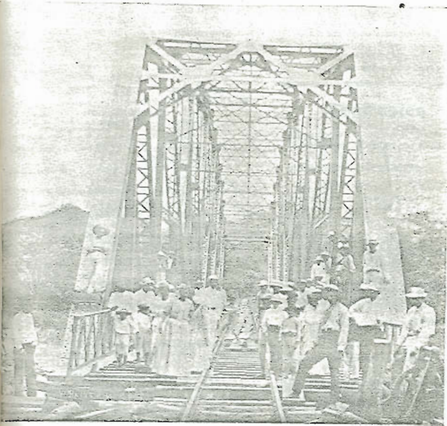
Una vista en el Puente de la Barranca — Ferrocarril al Pacífico